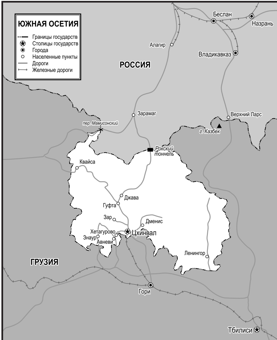
Карта 1. Южная Осетия

группы 104-го десантно-штурмового полка 76-й десантно-штурмовой дивизии. Личный состав был отправлен самолетами, а техника батальона – по железной дороге.